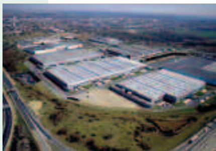
A Orléans, plusieurs plates-formes se sont créées pour constituer un véritable pôle logistique.

Pour aller plus loin dans cette étude de marché et dans la dimension prospective, les étudiants poursuivent leurs travaux en partenariat avec le club d'entreprises ADPE (Accueil développement et promotion des entreprises du Pays de Redon et de Vilaine).